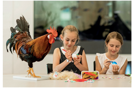
Eiermal-Werkstatt für Familien.

Was es Interessantes zum Thema «Eier» zu berichten gibt, erfahren Sie in der aktuellen Sonderausstellung. Zu sehen sind unterschiedlichste Tiereier aus der Museumsammlung. Zudem präsentieren wir lebende Hühner- und Wachteln mit ihren Küken, sowie Kaninchen, Achatschnecken und Grossinsekten.