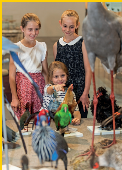
Die Vogelwelt auf dem Laufsteg.