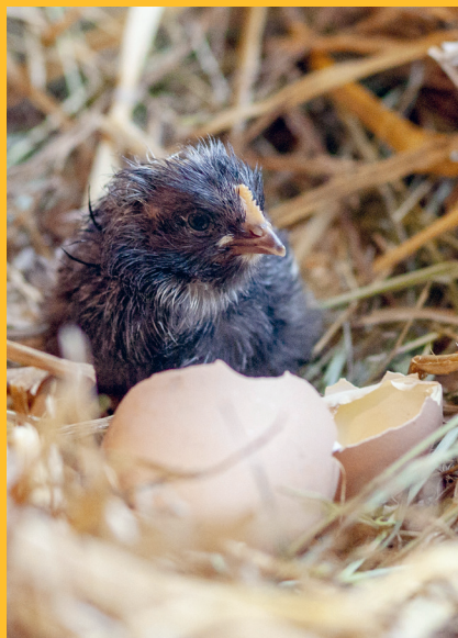
Frisch geschlüpfte Küken beobachten.