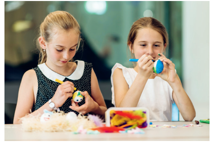
Eiermalen für Familien.

Die Sonderausstellung «Allerlei rund ums Ei» zeigt neben einer faszinierenden Vielfalt an Eiern auch zahlreiche Präparate aus der Welt der eierlegenden Tiere: vom Vogel Strauss bis zum Katzenhai und vom Schnabeltier bis zur Geburtshelferkröte. Mit etwas Geduld lässt sich in den Brutkästen das Wunder des Schlüpfens von Zwerghühnern und Wachteln beobachten und in Gehegen sind die ausgewachsenen Hühnervögel unterwegs.